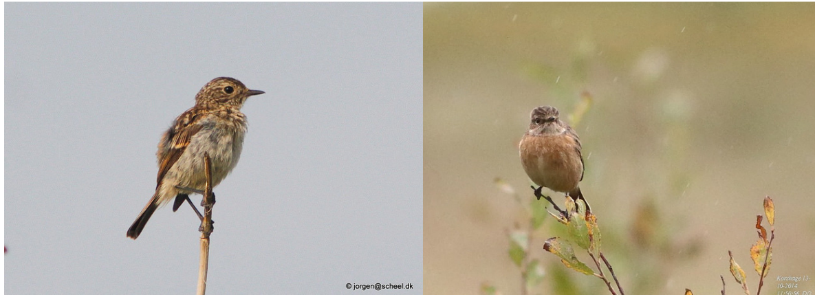
Sortstrubet Bynkefugl 1k 3/8-14 Korshage

Ude på Korshage fin Sorthovedet Måge 1k 6/8, en Lille Flagspætte 23/8 var usædvanligt og 31/8 dukkede en Nøddekrige op. Samme dag også en 1k Aftenfalk, der blev til 2/9.'